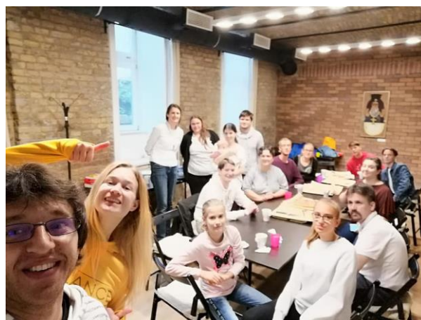
Életképek az október 23-i gimbal képzésről és az ezt megelőző, október 6-i pályázati eredményhirdetésről és csapatépítőről.