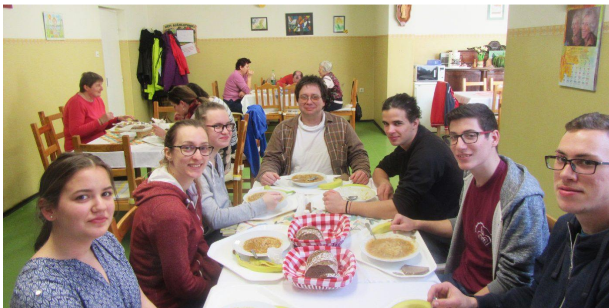
Néhány INIGO-s és Észak-Dunás önkéntes közös ebédje a sulimisszión