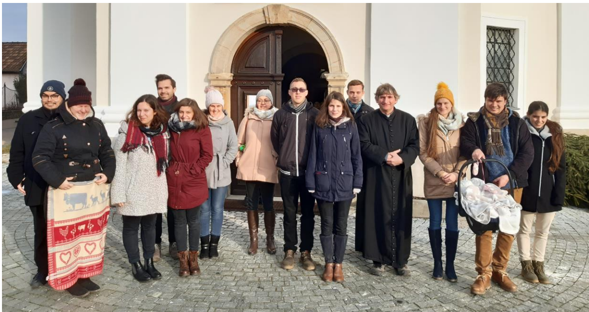
Régiófelelős hétvége - december 14-15. Szob