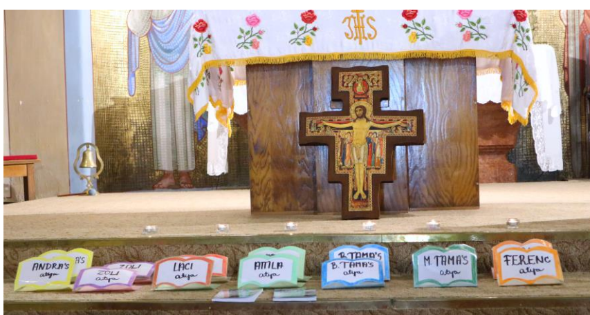
Szentgyónás a Galgamenti Táborban: az atyák nevei kis kártyákon szerepelnek. A nagylétszámú táborban sok atyára szükség van a gyóntatásnál.