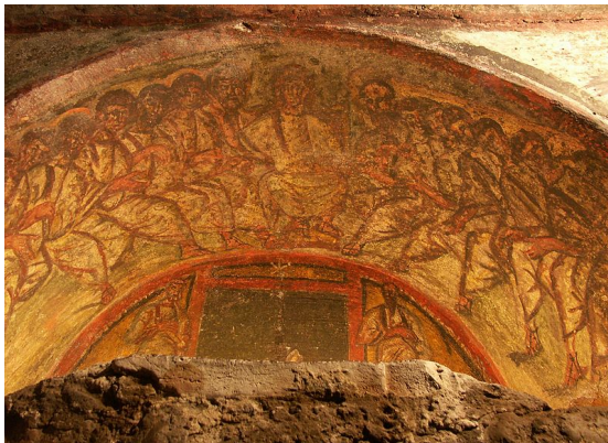
Domitilla-katakomba, Jézus és a 12 apostol